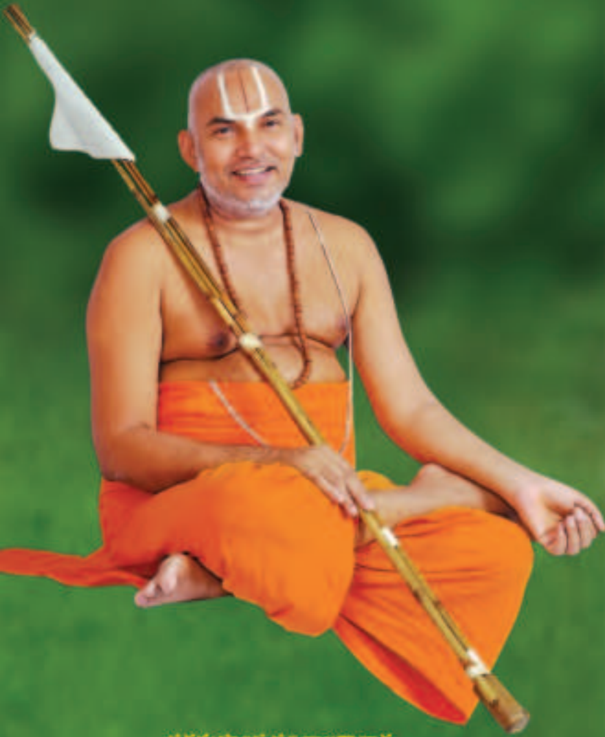
పరమహంస పరివ్రాజకాచార్య శ్రీశ్రీశ్రీ త్రిదండి శ్రీరంగ రామానుజ జీయర్ స్వామివారు

నైదిక సంప్రదాయమునకు చెందిన అనేక పురాతన గ్రంథములు పునర్ముద్రణకు బోధకావక జిజ్ఞాసువులకు గొప్ప కొరత కలుగుచున్నది. స్వీకరించినంత మూలముననే పొట్టువలె కాఠిరావు పుటలు గల పురాతన ప్రతులతోనే పంచితలోకము కాంక్షింపము చేయుచున్నది.